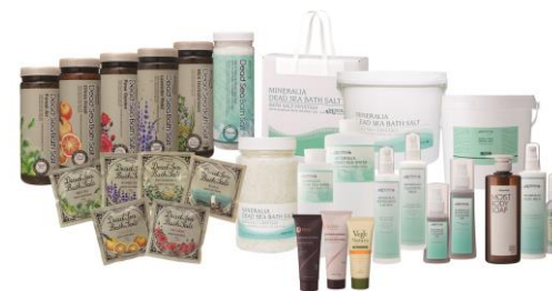
プロダクツ(店販用、業務用)