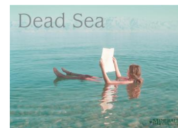
イメージ画像各種貸出しします

サロンケアで使用する業務用アイテム、店販用アイテムの他 季節にお勧めのキャンペーン商品を始め サービスキットとして、販促物や商品POPなど デッドシーセラピーをサロンですぐに始める為に、必要なものが揃っています。